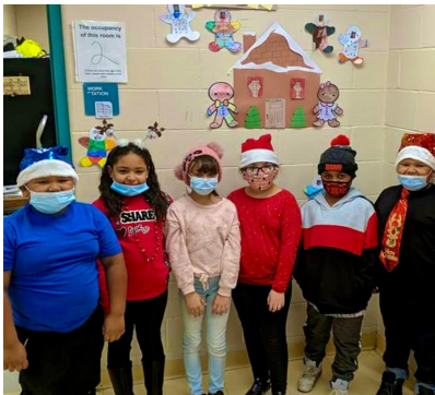
Arriba: Día del sombrero - Estudiantes del salón 212